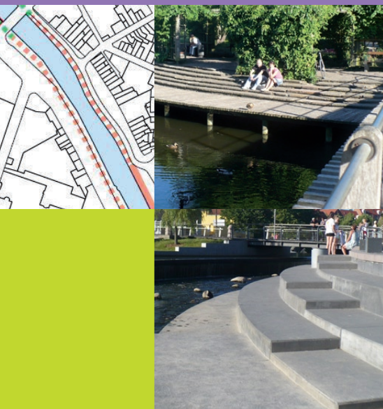
Quelques exemples d'aménagements de bords de rivières.